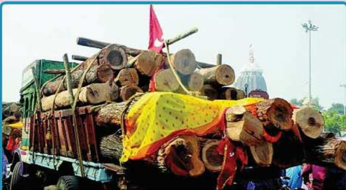
ତା. ୨୫.୧.୨୦ରେ ଚଳିତ ବର୍ଷ ରଥ ଯାତ୍ରା ନିମନ୍ତେ ନୟାଗଡ଼ ବନଖଣ୍ଡରୁ ପ୍ରଥମ ପର୍ଯ୍ୟାୟରେ ୨ ଗୋଟି ଟ୍ରକରେ ରଥ କାଠ ଶ୍ରୀକ୍ଷେତ୍ରର ରଥ ଖଳା ଠାରେ ପହଞ୍ଚିଛି ।