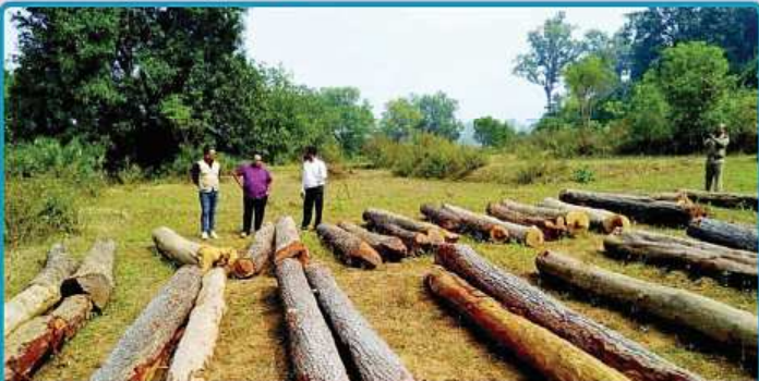
ଚଳିତ ବର୍ଷ ରଥ ଯାତ୍ରା ନିମନ୍ତେ ନୟାଗଡ଼ ବନଖଣ୍ଡ ଅଧିନସ୍ଥ ଜଙ୍ଗଲରେ 'କାଠ କଟା'ର ଶୁଭାରମ୍ଭ ।

ତା. ୨୧ ରିଖ ଗୁରୁବାର ଶ୍ରୀଗୁଣ୍ଡିଚା ଦିନ ପୂର୍ବାହ୍ନରେ ଶ୍ରୀଜିଉଙ୍କର ଖେଚେତା ଭୋଗ ଓ ରଥ ପ୍ରତିଷ୍ଠାଦି ବିଧି ଶେଷ ହୋଇ ପହଣ୍ଡି ବିକ୍ରୟ ଆରମ୍ଭ ହେଲା ଏବଂ ଠାକୁରମାନେ ଠିକ୍ ମଧ୍ୟାହ୍ନରେ ରଥାରୁତ୍ ହେଲେ । ରଥମାନଙ୍କରୁ ଚାରଫିଟି ସାରଥୀ ସ୍ଥାପନାଦି କାର୍ଯ୍ୟରେ ପ୍ରାୟ ୧୯୫୩ ଅତୀତ ହେବା ପରେ ରଥ ଚାରିପାଖେ ଦଉଡ଼ି ଘେରା ଓ ଯଥାରୀତି ପୁଲିଶ ମୁତବନ ହୋଇ ମାଜିଷ୍ଟ୍ରେଟ୍ ଓ ପୁଲିଶ ସାହେବ ପ୍ରଭୃତିଙ୍କ ଉପସ୍ଥିତରେ ତିନି ରଥରେ ଦଉଡ଼ି ଲାଗି ଯଥାକ୍ରମେ ରଥଚଣା ଆରମ୍ଭ ହେଲା ଏବଂ ଠାକୁରମାନେ ଶ୍ରୀଗୁଣ୍ଡିଚା ମନ୍ଦିରାଭିମୁଖେ ଯାତ୍ରା କଲେ । ଏ ଦିନ ସ୍ୱଦେଶୀ, ବିଦେଶୀ ସମେତ ମୋଟ ଯାତ୍ରୀ ସଂଖ୍ୟା ୪୦/୫୦ ହଜାର ହୋଇଥିଲା । ସେଥି ମଧ୍ୟରୁ ଅଧିକାଂଶ ବଙ୍ଗାଳୀ ସାମାନ୍ୟ ପଣ୍ଡିମା ଅବଶିଷ୍ଟ ଉତ୍କଳୀୟ ଥିଲେ ।