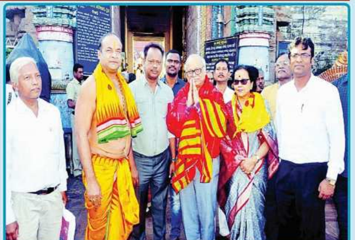
ତା. ୩. ୧. ୨୦ରେ ପାକିସ୍ତାନରେ ବାସ କରୁଥିବା ୧୩୩ ଜଣ ପାକିସ୍ତାନୀ (ହିନ୍ଦୁ) ଶ୍ରୀମନ୍ଦିରରୁ ଶ୍ରୀବିଗ୍ରହମାନଙ୍କର ଦର୍ଶନ ସାରି ଫେରୁଛନ୍ତି ।