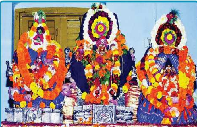
ତା. ୩୦.୧.୨୦ରେ ଶ୍ରୀମନ୍ଦିରରେ ବସନ୍ତ ପଞ୍ଚମୀ ତଥା ସରସ୍ୱତୀ ପୂଜା ପରିପ୍ରେକ୍ଷାରେ ଶ୍ରୀଜଗନ୍ନାଥ ବଲ୍ଲଭ ପରିସରରେ ବେଞ୍ଚ ଶିକାର ନିମନ୍ତେ ଦୋଳଗୋବିନ୍ଦଙ୍କସହ ଶ୍ରୀଦେବୀ ଓ ଭୂଦେବୀ ବିରାଜମାନ କରିଛନ୍ତି ।