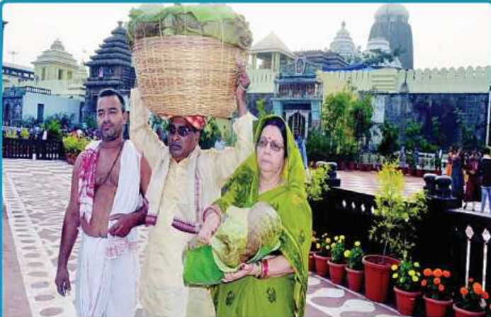
ତା. ୨୯.୧.୨୦ରେ ଉଚ୍ଚ ଚିନ୍ତାମଣି ଦାଶ ସମ୍ପାଦକ ଶ୍ରୀବିଗ୍ରହମାନଙ୍କ ନିମନ୍ତେ ପଦ୍ମ ବେଶ ପାଇଁ 'ପଦ୍ମ ଫୁଲ' ଧରି ଶ୍ରୀମନ୍ଦିରକୁ ପ୍ରବେଶ କରୁଛନ୍ତି ।