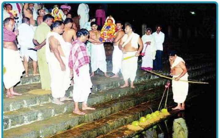
ତା. ୩୦.୧.୨୦ରେ ଶ୍ରୀମନ୍ଦିରରେ ବସନ୍ତ ପଞ୍ଚମୀ ତଥା ସରସ୍ୱତୀ ପୂଜା ପରିପ୍ରେକ୍ଷାରେ ଶ୍ରୀଜଗନ୍ନାଥ ବଲ୍ଲଭ ଠାରେ ମହାପ୍ରଭୁଙ୍କ ପାରମ୍ପରିକ 'ବେଞ୍ଚ ନୀତି' ପାଳନ କରାଯାଇଛି ।