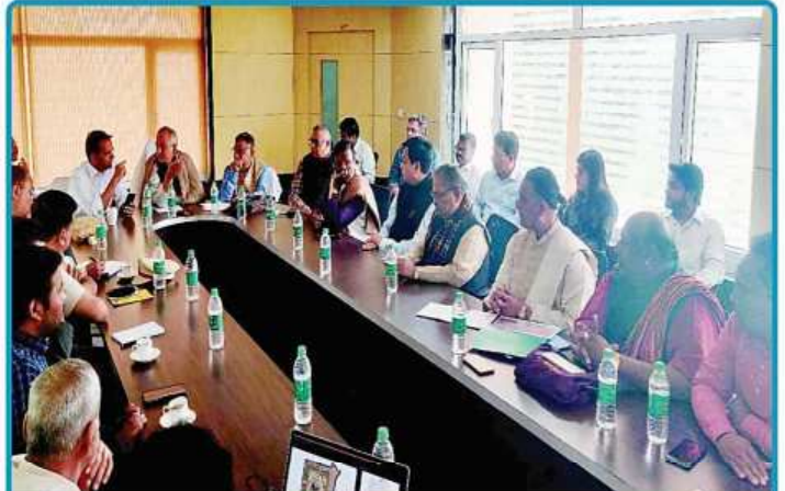
ତା. ୪.୨.୨୦ରେ ଭୁବନେଶ୍ୱର ଠାରେ ଗଜପତି ମହାରାଜା ଶ୍ରୀ ଦିବ୍ୟସିଂହ ଦେବଙ୍କ ଅଧକ୍ଷତାରେ ଆହୂତ 'ଶ୍ରୀମନ୍ଦିର ଐତିହ୍ୟ କରିଭ୍ର' ସମ୍ପର୍କିତ ଉଚ୍ଚସ୍ତରୀୟ ବୈଠକ ।