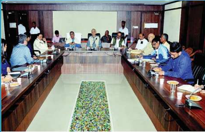
ତା. ୩୦.୧୨.୧୯ରେ ଶ୍ରୀମନ୍ଦିର ମୁଖ୍ୟ କାର୍ଯ୍ୟାଳୟ ଠାରେ ଗଜପତି ମହାରାଜା ଶ୍ରୀ ଦିବ୍ୟସିଂହ ଦେବଙ୍କ ଅଧକ୍ଷତାରେ ଆହୂତ 'ଶ୍ରୀମନ୍ଦିର ହେରିଟେଜ୍ କୋର୍ଡ୍ ପାଇଁ ଆଲୋଚନା ଚକ୍ର' ବୈଠକ ।